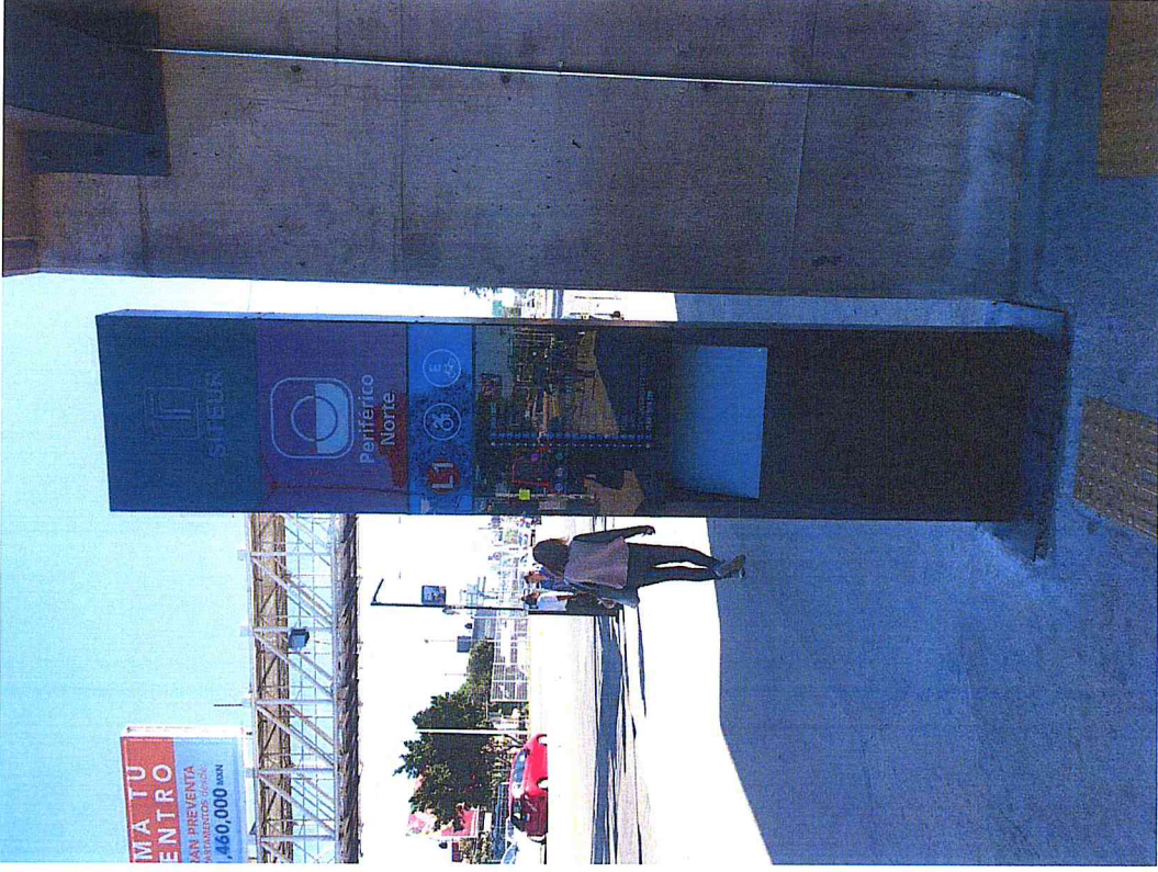
Estación Periférico Norte Instalación Tótem informativo DICIEMBRE