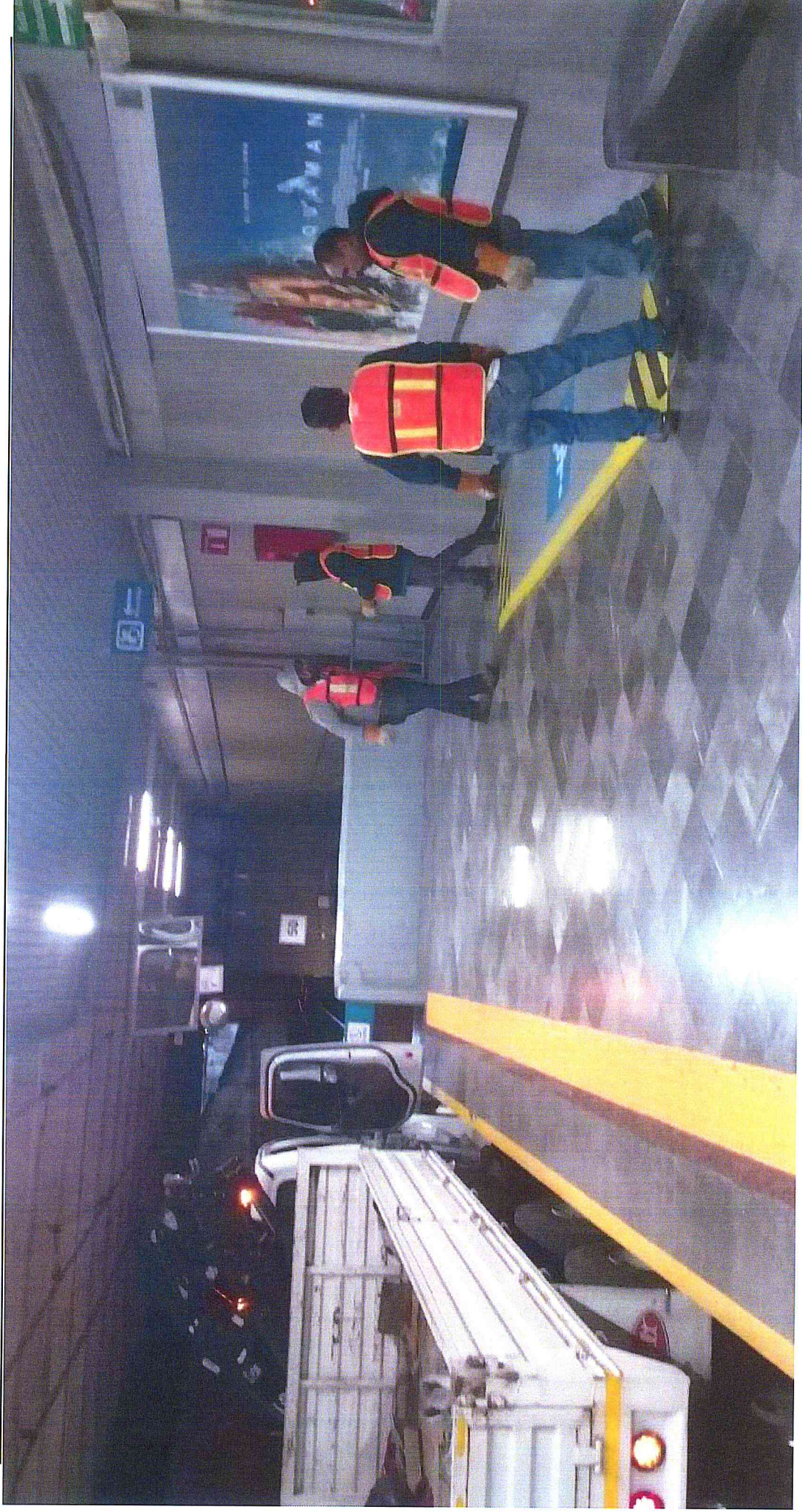
Estación Washington Suministro de Reductor de Gálbo DICIEMBRE